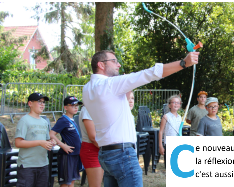
Par David Bustin, Maire de Vieux-Condé