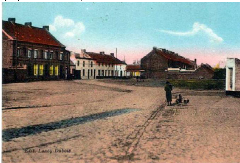
▽ La place Vermeersch telle qu'on la connaissait avant

Calmes comme des vieux braves, sans baisser la tête ni les yeux, un petit sourire en coin, tous les écoliers croisèrent les bras et subirent leur punition sans un seul mot de plus.