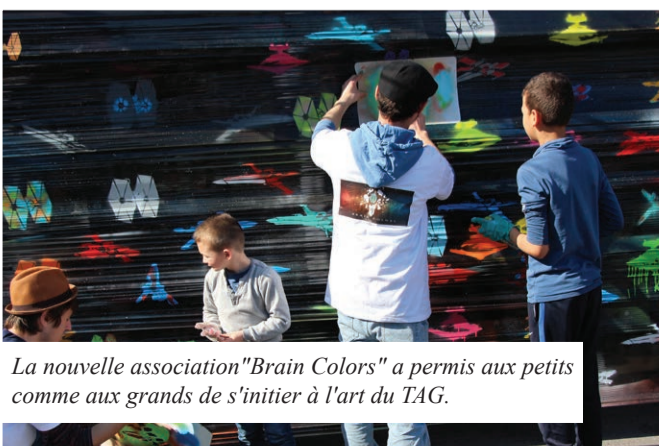
La nouvelle association "Brain Colors" a permis aux petits comme aux grands de s'initier à l'art du TAG.