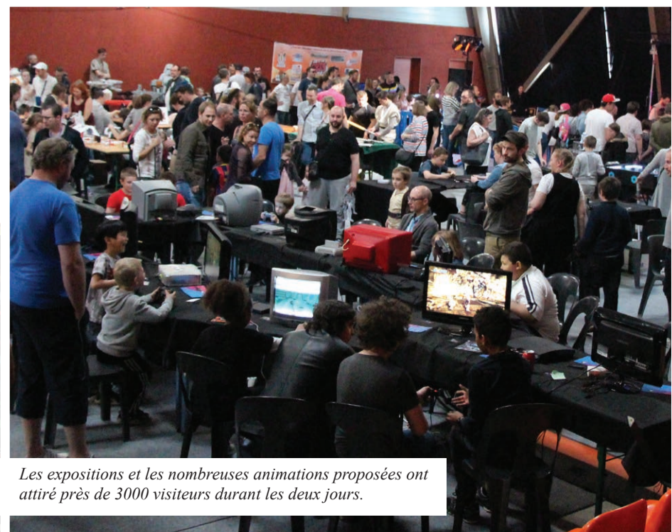
Les expositions et les nombreuses animations proposées ont attiré près de 3000 visiteurs durant les deux jours.