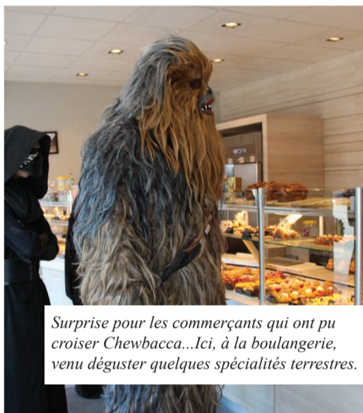
Surprise pour les commerçants qui ont pu croiser Chewbacca... Ici, à la boulangerie, venu déguster quelques spécialités terrestres.