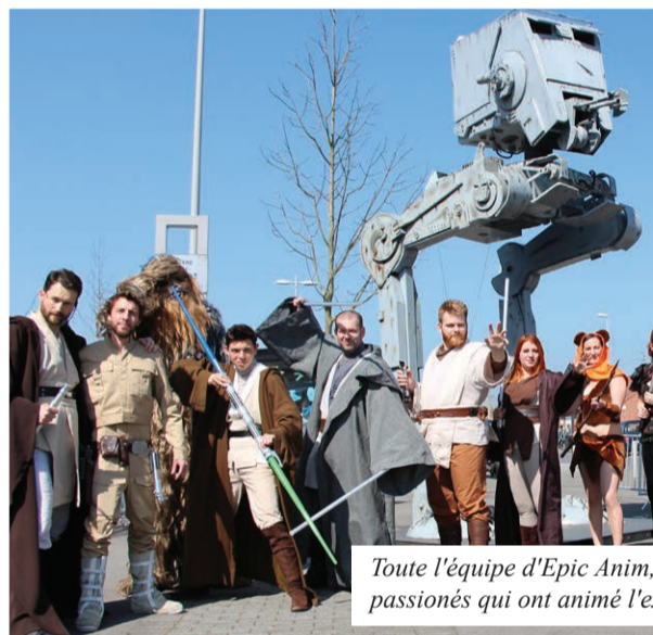
Toute l'équipe d'Epic Anim, devant l'AT-ST en taille réelle, des cosplayers passionnés qui ont animé l'exposition durant les deux jours.