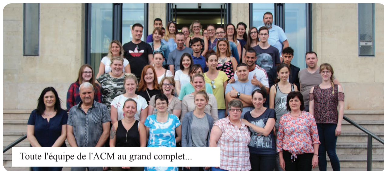
Toute l'équipe de l'ACM au grand complet...