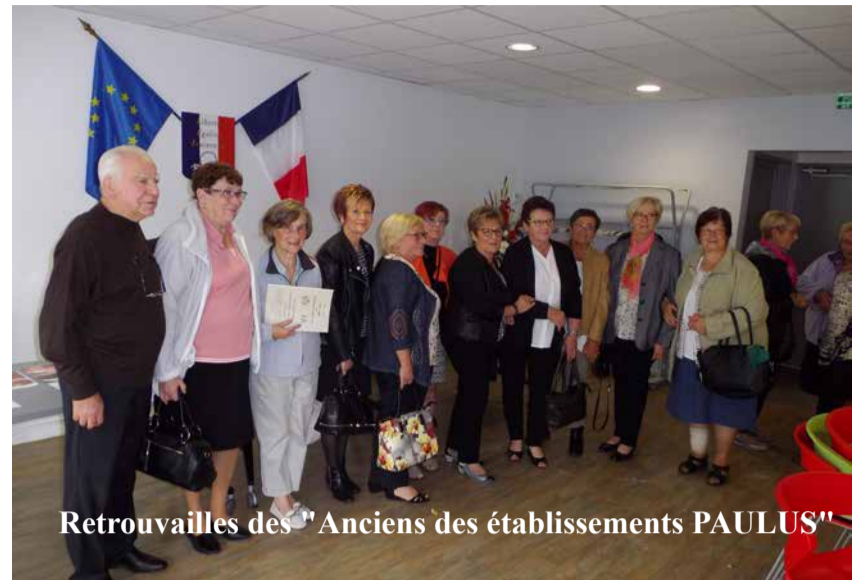
Retrouvailles des "Anciens des établissements PAULUS"