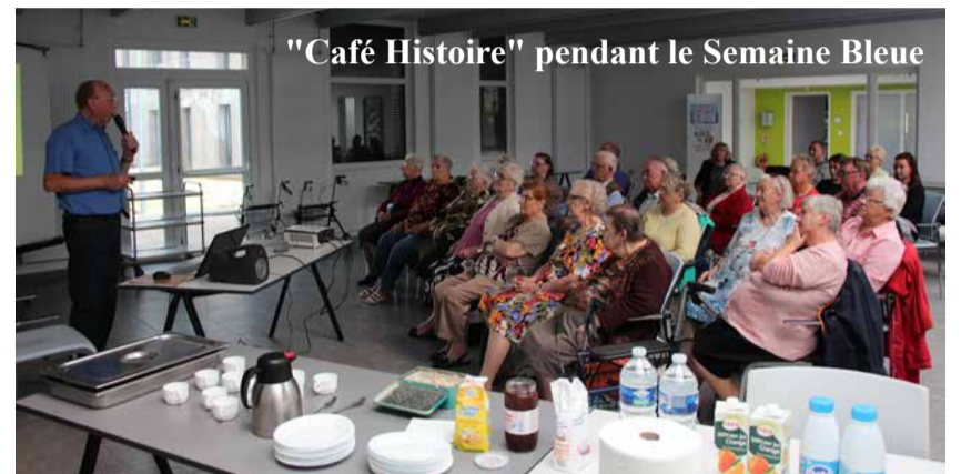
"Café Histoire" pendant le Semaine Bleue