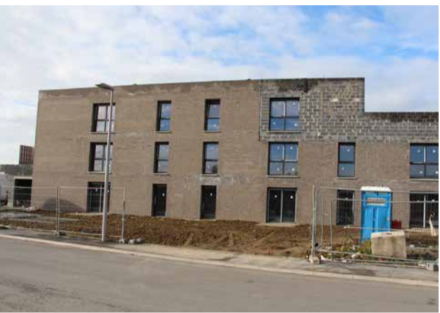
règlement de construction.

En face, les parcelles qui seront prochainement mises en vente font l'objet d'une étude d'implantation plus poussée et d'un petit