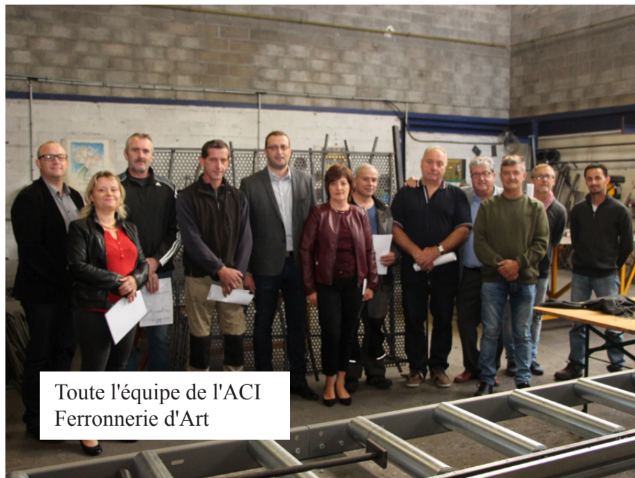
Toute l'équipe de l'ACI Ferronnerie d'Art