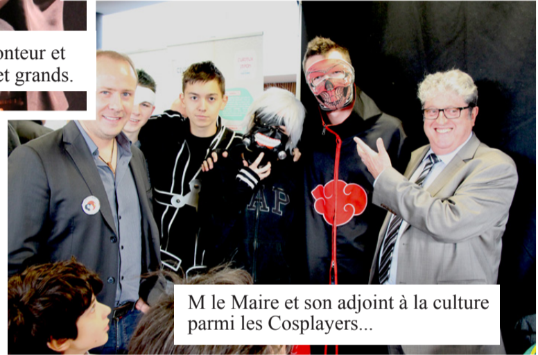
M le Maire et son adjoint à la culture parmi les Cosplayers...

Dans les murs du Dojo Jean Louis Borloo , la diversité des nombreux spectacles et ateliers proposés ont permis à chacun des 2000 visiteurs d'y trouver leur compte. L'implication des associations de la ville et l'engagement des services municipaux ont quant à eux donné à l'ensemble du projet son caractère convivial et chaleureux. Un grand merci à tous.