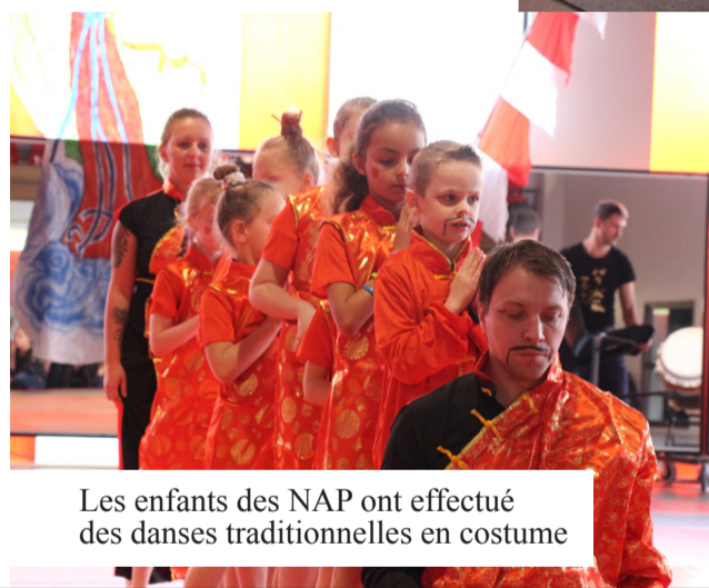
Les enfants des NAP ont effectué des danses traditionnelles en costume