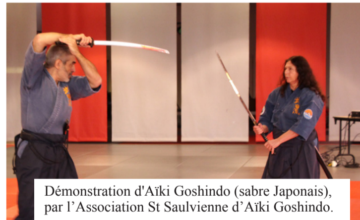
Démonstration d'Aïki Goshindo (sabre Japonais), par l'Association St Saulvienne d'Aïki Goshindo.