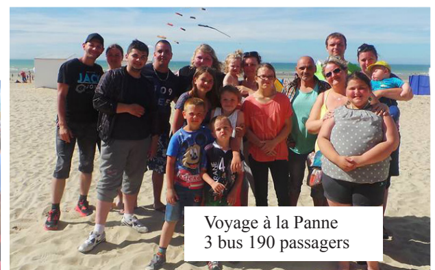
Voyage à la Panne 3 bus 190 passagers