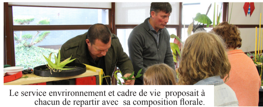
Le service environnement et cadre de vie proposait à chacun de repartir avec sa composition florale.

EXPO VAUBAN 2016 15ÈME SALON RÉGIONAL DU MODÈLE RÉDUIT Samedi 29 Octobre - Dimanche 30 Octobre 14H-18H