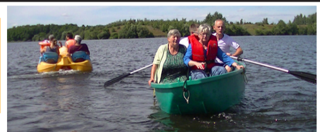
Pic-nic à CHABEAU-LATOIR 35 à 40 personnes, une magnifique journée!