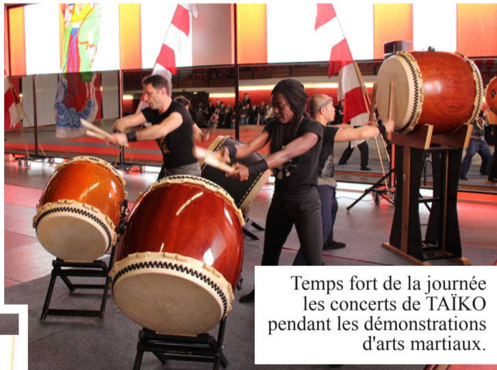
Temps fort de la journée les concerts de TAÏKO pendant les démonstrations d'arts martiaux.