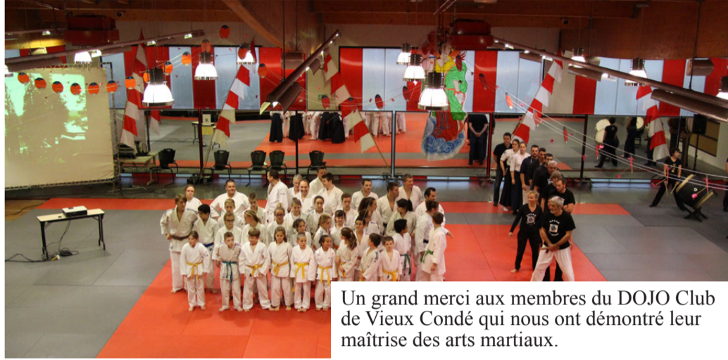
Un grand merci aux membres du DOJO Club de Vieux Condé qui nous ont démontré leur maîtrise des arts martiaux.